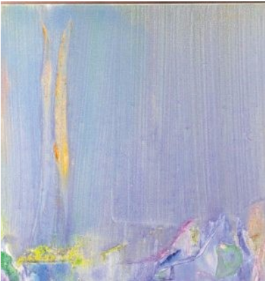
Une estimation de 50 000 à 60 000 € pour ce tableau d'Olivier Debré. Diman- che, à Honfleur.