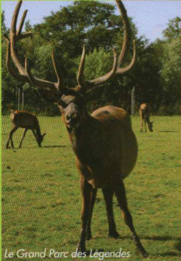
Le Grand Parc des Légendes

Saint Vital , ermite irlandais, vécut sur le Pays de Retz Atlantique au VIII e siècle. Il fut l'auteur de nombreux miracles, dont le principal fut de faire jaillir de terre une source, alors que gens, bêtes et plantes mouraient de soif.